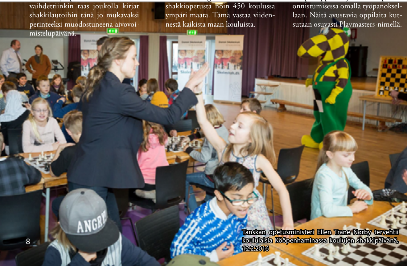
Tanskan opetusministeri Ellen Trane Nørby tervehtii koululaisia Kööpenhaminassa koulujen shakkipäivänä, 12.2.2016

Tanskalaiset ovat hankkineet koulushakkitoimintaan useita yhteistyökumppaneita, joiden avulla tapahtumia on pystytty kehittämään monipuolisesti. Yksi sponsoreista on yksi Tanskan suurimmista sanomalehdistä, Politiken.