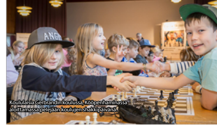
Koululaisia Gerbrandin koulussa, Kööpenhaminassa aloittamassa pelejään koulujen shakkipäivänä.

Tanskalaiset ovat hankkineet koulushakkitoimintaan useita yhteistyökumppaneita, joiden avulla tapahtumia on pystytty kehittämään monipuolisesti. Yksi sponsoreista on yksi Tanskan suurimmista sanomalehdistä, Politiken. Media-alan yhteistyökumppanit ovatkin shakkijärjestöille erityisen tervetulleita, koska laajan näkyvyyden saaminen helpottuu niiden avulla merkittävästi. Kouluille eri tapahtumiin osallistuminen on varsin edullista, eikä kustannuksista näin ollen muodostu kynnyskysymystä mukanaololle.