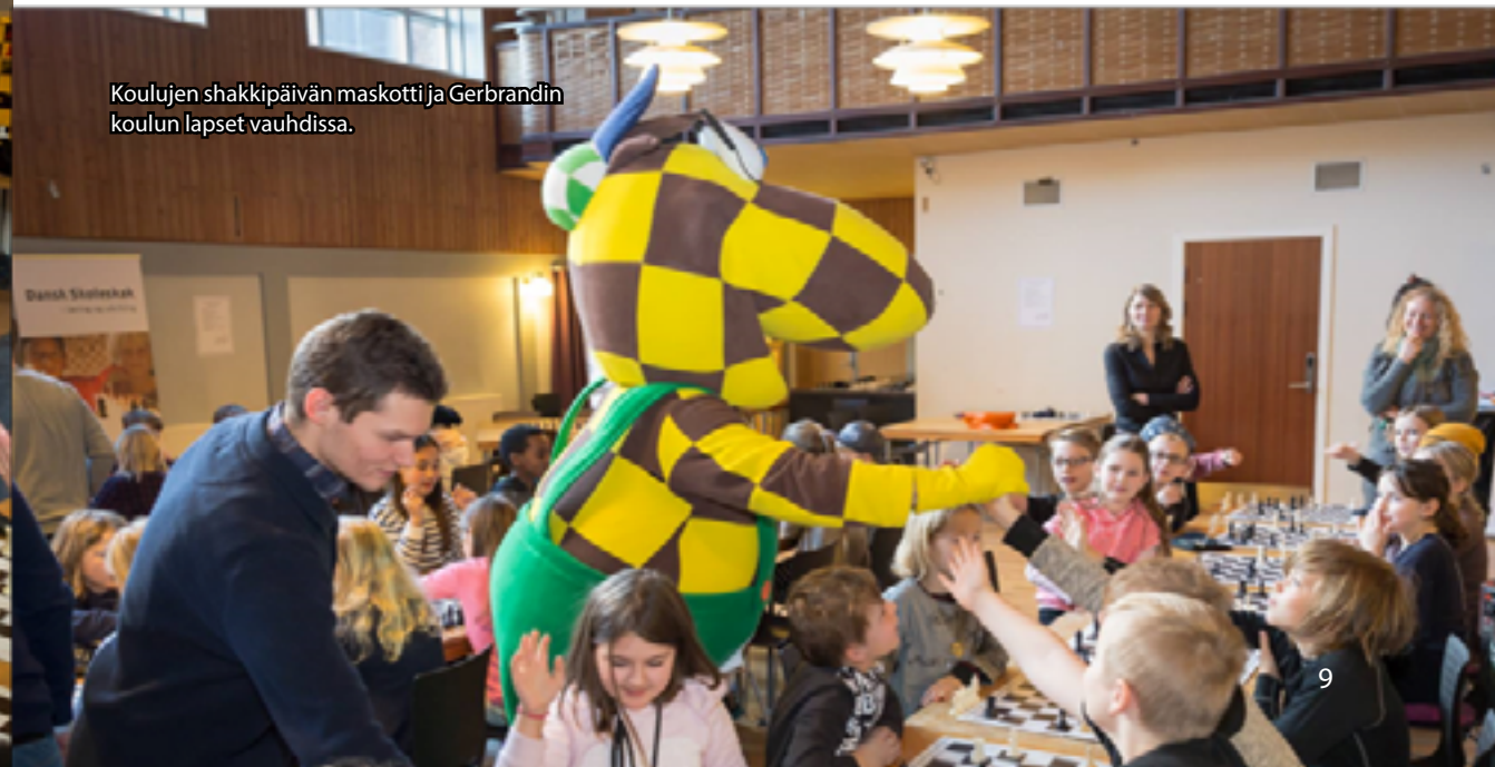
Koulujen shakkipäivän maskotti ja Gerbrandin koulun lapset vauhdissa.